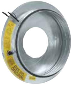
Registre à iris

Le registre à iris permet d'équilibrer finement un réseau circulaire tout en garantissant un très faible taux de fuite (étanchéité classe C).