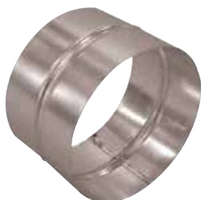
Raccord Femelle en aluminium

Le raccord femelle alu permet de raccorder deux accessoires aluminium entre eux.