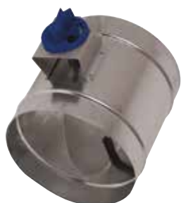
Registre d'Equilibrage en aluminium

Le registre d'équilibrage alu permet de régler la pression dans des branches de réseaux aérauliques en aluminium en bâtiment tertiaire ou collectif.