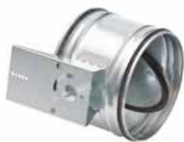
RGE M à joint motorisable

Le registre RGE Motorisable permet d'équilibrer et d'isoler avec un moteur un réseau circulaire tout en garantissant un très faible taux de fuite.