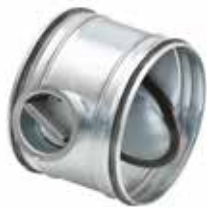
RGE à joint manuel

Le registre RGE permet d'équilibrer et isoler manuellement un réseau circulaire tout en garantissant un très faible taux de fuite.