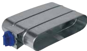
Registre d'Equilibrage Oblong

Le registre d'équilibrage oblong permet de régler la pression dans des branches de réseaux aérauliques en oblong en bâtiment tertiaire ou collectif.