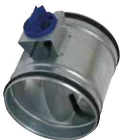
Registre d'Equilibrage Perforé en aluminium

Le registre d'équilibrage alu permet de régler la pression dans des branches de réseaux aérauliques en aluminium en bâtiment tertiaire ou collectif.