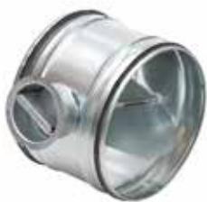
Registre RG à joints

Le registre RG à joints permet d'équilibrer un réseau circulaire tout en garantissant un très faible taux de fuite classe D (jusqu'à D315 inclus) ou C (à partir du D355).