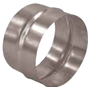
Raccord Mâle en aluminium

Le raccord mâle alu permet de raccorder deux conduits aluminium entre eux.