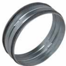
Raccord Mâle à joints

Le raccord mâle à joints permet de raccorder deux conduits galvanisés entre eux tout en assurant une étanchéité classe C.