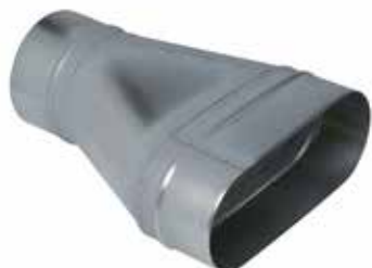
Réduction Oblongue Cylindrique Tangentielle sur Plat

La ROCTP permet de raccorder un réseau oblong à un réseau circulaire tout en conservant un réseau linéaire et plat, sans perte de place vers le bas.