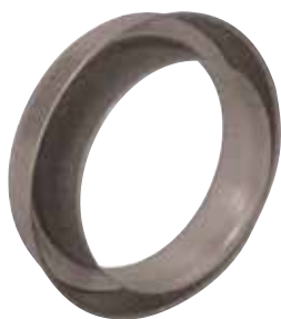
Réduction Plate Concentrique en aluminium

La RPC alu permet de raccorder deux conduits aluminium de diamètres différents entre eux sur un minimum de longueur.