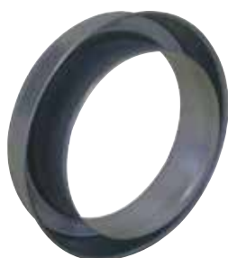
Réduction Plate Concentrique

La RPC permet de raccorder deux conduits galvanisés de diamètres différents entre eux sur un minimum de longueur.