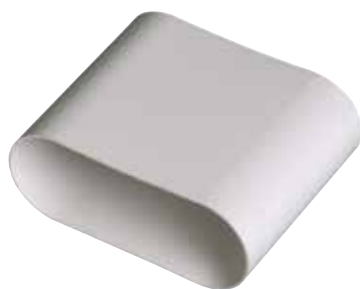
Raccord mâle 40x100 mm