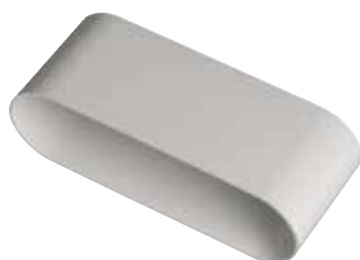
Raccord mâle 60x200 mm