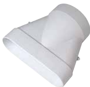
Raccord pour conduit