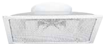
Diffuseur SC 310R

Le SC 310 R est un diffuseur de soufflage carré à tôle perforée ouvrante réglable de 1 à 4 directions grâce à des déflecteurs orientables.