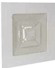
SC360RIF(5)F16 D250 AxB=600x600 c66.5

Le SC 310 R est un diffuseur de soufflage carré à tôle perforée ouvrante réglable de 1 à 4 directions pour dalle de plafond standard.