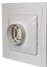
Diffuseur SC 369R

Le SC 369 R est un diffuseur carré à tôle perforée pour la reprise d'air.