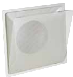
SC370W3 FO 598x598

La grille pour dalle de plafond SC 370 assure la reprise d'air dans les installations de ventilation et de climatisation avec une esthétique discrète.