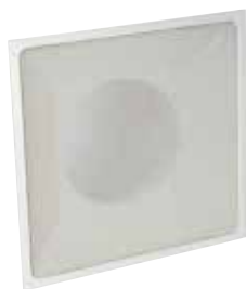
SC370 FO 598x598

La grille pour dalle de plafond SC 370 assure la reprise d'air dans les installations de ventilation et de climatisation avec une esthétique discrète.