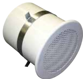
SCR 125 F14 D 160

La SCR 125 est une bouche de reprise ou soufflage spécialement adaptée pour le milieu carcéral et les locaux psychiatriques.