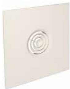
SC 832 TP F0 D200 (AxB=600x600)

Le SC 832 TP est un diffuseur concentrique en acier pour la diffusion d'air fixe et soufflage horizontal, conçu pour remplacer une dalle de plafond standard.