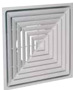
SF704R TP F16 D250 BLC/WHI AxB600x600

Le SF 704 R TP est un diffuseur carré plafonnier avec 4 directions de soufflage avec plénum intégré pour la diffusion d'air dans les locaux tertiaires.