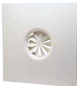
SF 861 T FO D200 AxB=600x600 (c20)

Le SF 861 T est un diffuseur plafonnier fixe à jet hélicoïdal pour la diffusion d'air dans les locaux tertiaires.