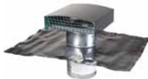
Sortie de Toit Standard

La sortie de toit standard a été conçue pour la VMC et le traitement d'air dans les logements collectifs et les immeubles tertiaires.