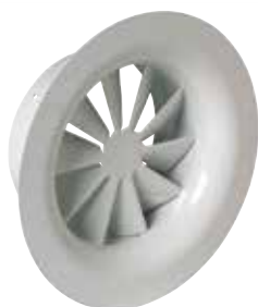
SR861 F0 D250 (c25) RAL9010-85%

Le SR 861 est un diffuseur fixe à haute induction à jet d'air hélicoïdal pour la diffusion d'air dans les bâtiments tertiaires.