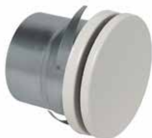
SR 135 D200 RAL9003

La bouche à noyau SR 135 esthétique réglable assure la diffusion ou la reprise d'air avec un faible niveau acoustique.