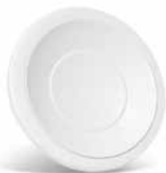
SR 145 D100

La bouche à noyau SR 145 en acier au débit réglable sur site assure le soufflage d'air.