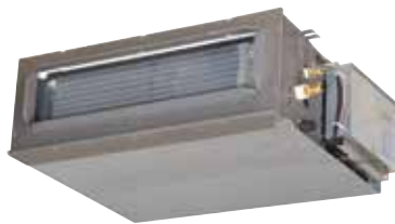
T.One® Horizontal 10

La solution innovante et sur-mesure pour se chauffer confortablement.