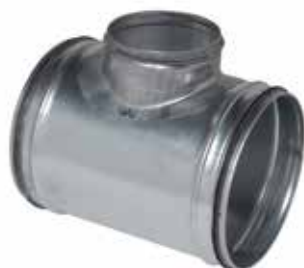
Té Equerre à joints

Le TE 90° à joints permet de raccorder deux conduits galvanisés avec un angle de 90° tout en assurant une étanchéité classe C.