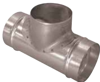
Té Equerre 90° en aluminium

Le TE 90° alu permet de raccorder deux branches de réseau aluminium avec un angle de 90°.