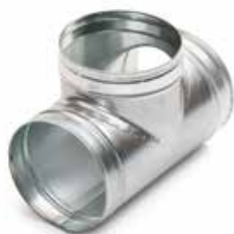
Té Equerre 90°

Le TE 90° permet de raccorder deux branches de réseau galvanisé avec un angle de 90°.