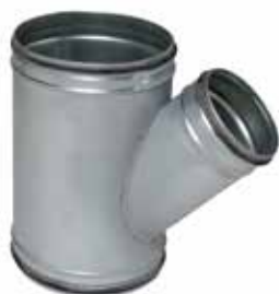
Té Oblique à joints

Le TO à joints permet de raccorder deux conduits galvanisés avec un angle de 45° tout en assurant une étanchéité classe C.