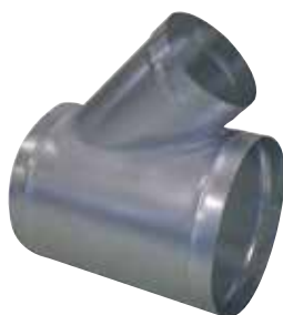
Té Oblique 45°

Le TE 45° permet de raccorder deux branches de réseau galvanisé avec un angle de 45°.