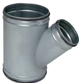
Té Oblique à joints

Le TO à joints permet de raccorder deux conduits galvanisés avec un angle de 45° tout en assurant une étanchéité classe C.