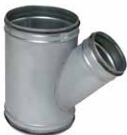
Té Oblique à joints

Le TO à joints permet de raccorder deux conduits galvanisés avec un angle de 45° tout en assurant une étanchéité classe C.