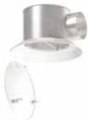
TWISTED 850 D200 STAFF

Le TWISTED® 850 est un diffuseur à haute induction à jet d'air hélicoïdal pour la diffusion d'air dans les bâtiments tertiaires.