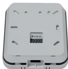
Télécommande EasyHOME SensAIR Vue arrière