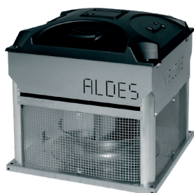
VELONE F400-120 1.5

VELONE F400 - 1.5 - Tri / Mono est une tourelle de désenfumage classée F400-120 destinée aux locaux tertiaires, industriels et logements collectifs.