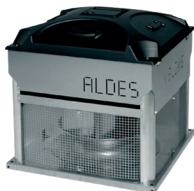
VELONE F400-120 13

VELONE F400 - 13.0 - Tri est une tourelle de désenfumage classée F400-120 destinée aux locaux tertiaires, industriels et logements collectifs.