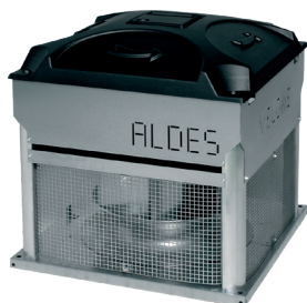
VELONE F400-120 20

VELONE F400 - 20.0 - Tri est une tourelle de désenfumage classée F400-120 destinée aux locaux tertiaires, industriels et logements collectifs.