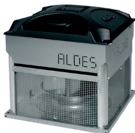
VELONE F400-120 3.2

VELONE F400 - 3.2 - Tri / Mono est une tourelle de désenfumage classée F400-120 destinée aux locaux tertiaires, industriels et logements collectifs.