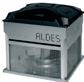
VELONE F400-120 4.5

VELONE F400 - 4.5 - Tri / Mono est une tourelle de désenfumage classée F400-120 destinée aux locaux tertiaires, industriels et logements collectifs.