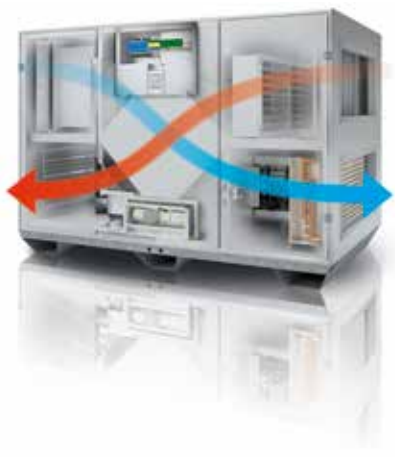
Visualisation des flux d'air au sein d'une VEX500