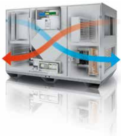
Visualisation des flux d'air au sein d'une VEX500