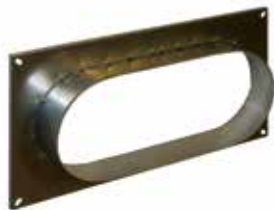
Virole oblongue pour clapet ISONE 2 rectangulaire

VIROLE OBLONGUE ISONE®2.1 360x80/400x200